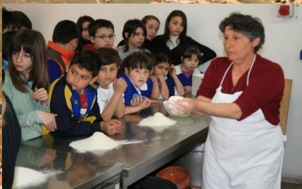
Biologico nelle scuole