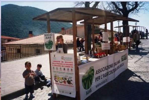
Mercatini del biologico